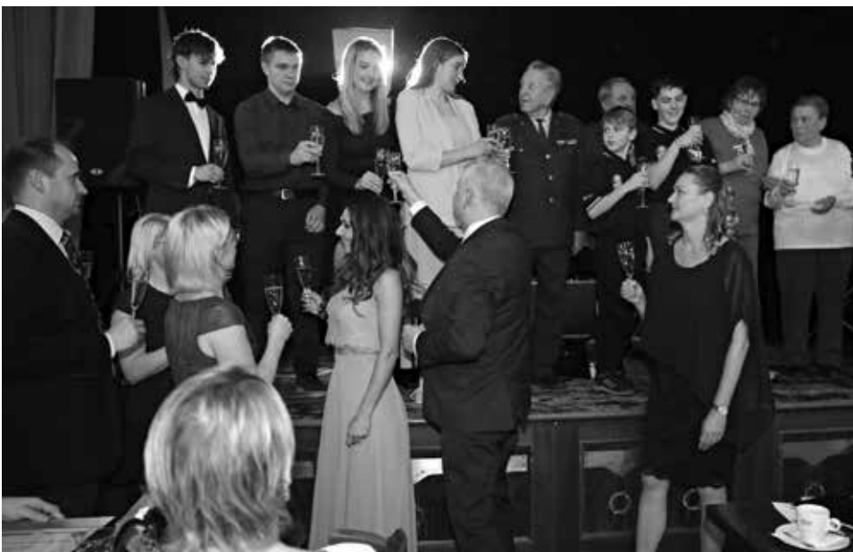
Na závěr slavnostního ceremoniálu si všichni ocenění společně připili na pódiu historického sálu Hotelu U Zeleného stromu

Oceněným gratulujeme a děkujeme pořadatelům za krásný večer. (redakčně upraveno)