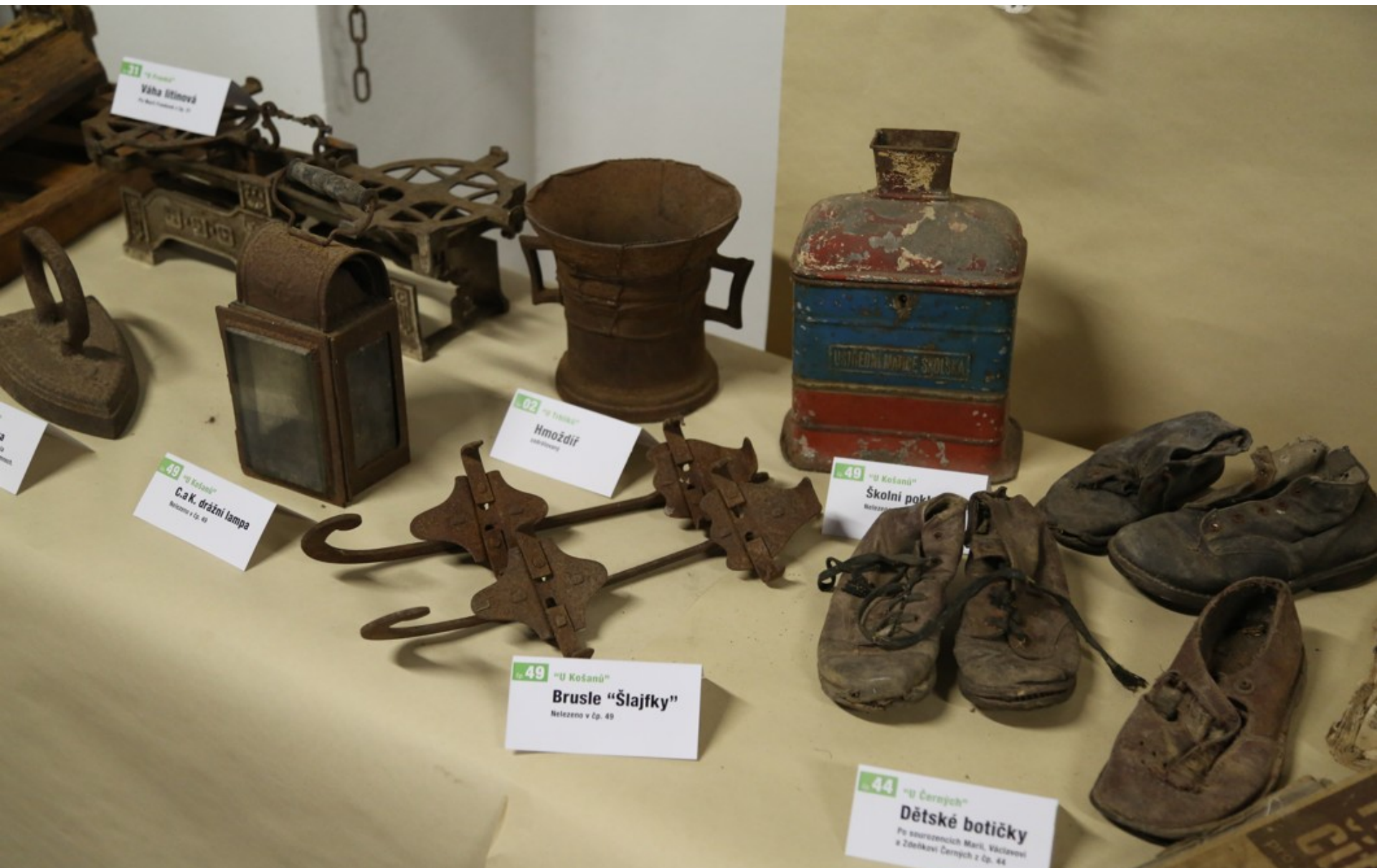
31 "U Právníků" Váha šitinná Přibližně 18. st.