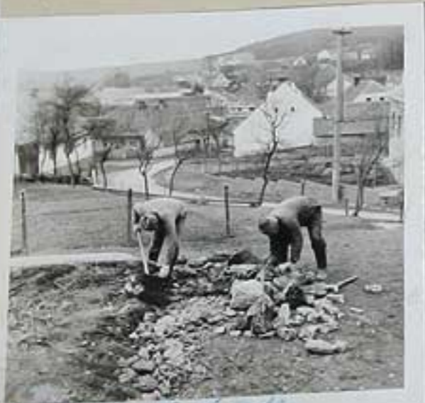
Ko's in front of Co. 45