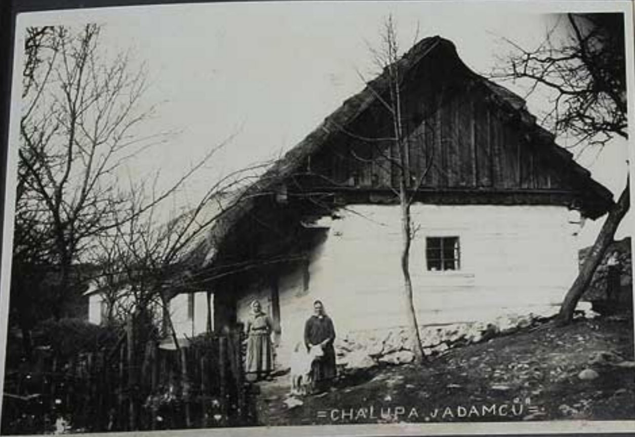
= CHALUPA JADAMCŮ =

bývalý správce velké statku Střelohostice u Strakonice, majitel "Křídlováku" za- kupující a prodávající všechnu dělnic tvoř.