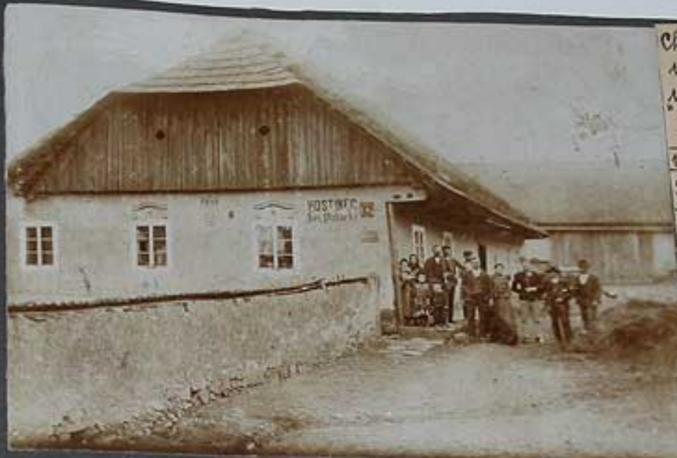
Chalupnická usedlost č. 10. u Palackých roku 1973.