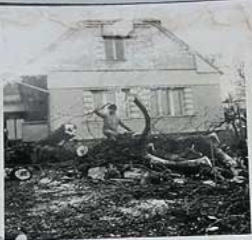
č.p. 12 + 52