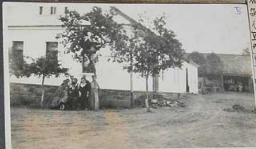
XI) Mladý Palacký s malými chlapci 2 m.