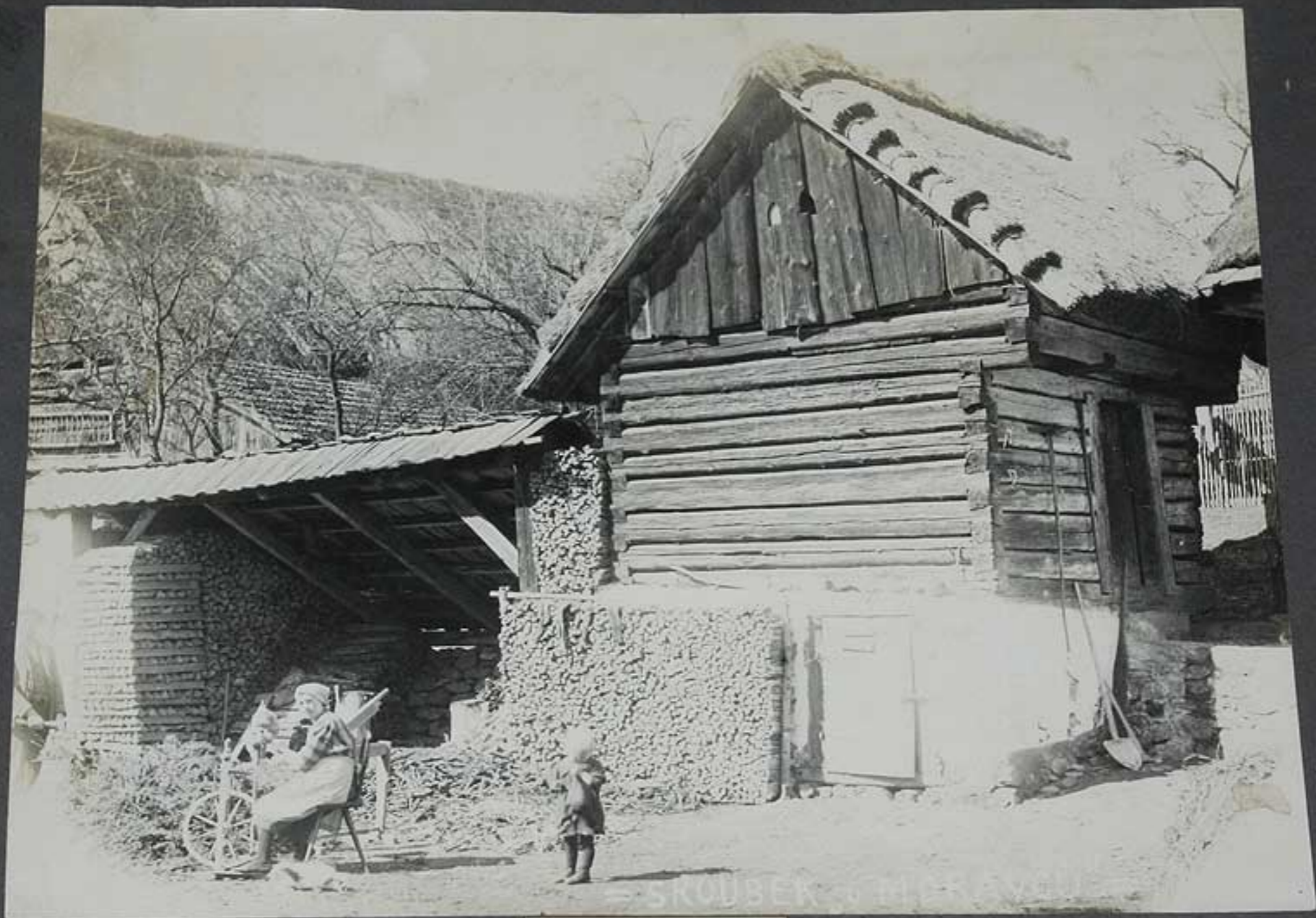
Starý sroubek v Moravii řp. 14. v první polovině XVII. století. -