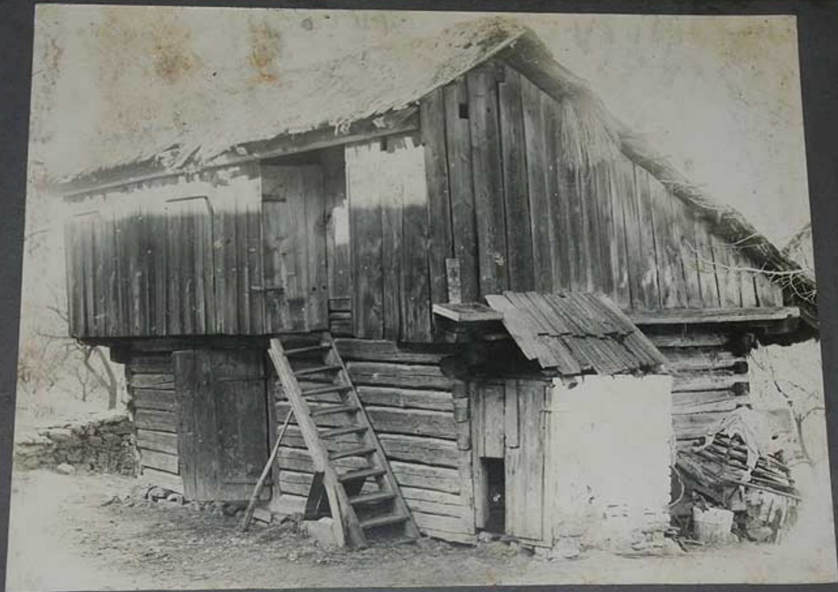
Dřevěné chlévce u Pešků čp. 20. z počátku XIX. s.